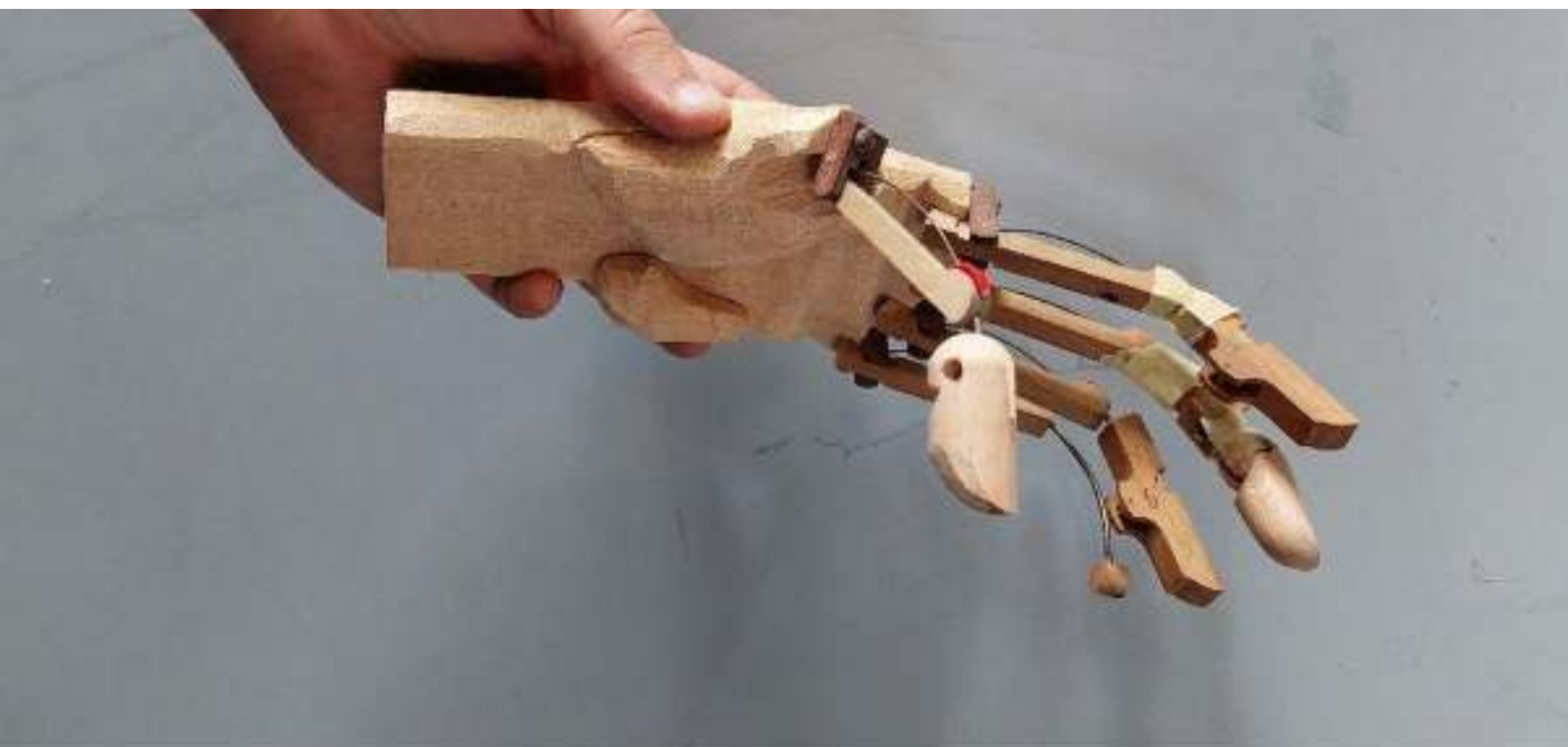
8: mão da marioneta

No geral, a vertente editorial no seio de uma companhia é importante para preservar a história da companhia, documentar as suas técnicas e estilos, partilhar conhecimentos e habilidades e promover a companhia e o seu trabalho.